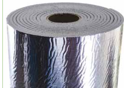
TROCELLEN CL 1 ALU LISCIO