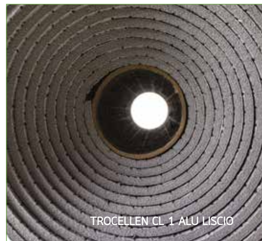
TROCELLEN CL 1 ALU LISCIO

Euroclass B-s2,d0 per spessori 3-12 mm, adesivo, a norma EN 13501-1, verde chiaro